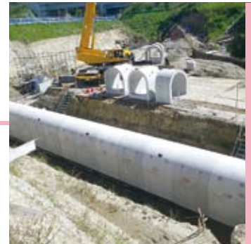
アーチカルバート類