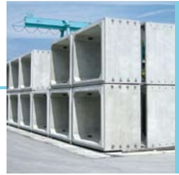
ボックスカルバート類